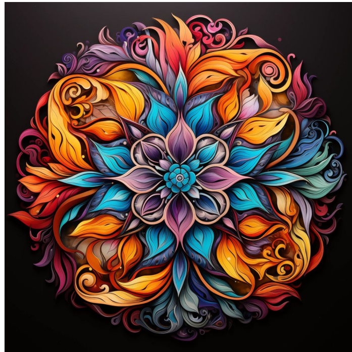
Kinergias - Camino a la consciencia

Una herramienta sencilla para la relajación, la creatividad y el bienestar consciente.